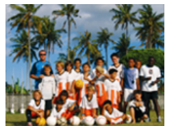
Candidats à l'expatriation ou résidents à Bali, consultez nos rubriques ci-dessous :

Téléchargez la Gazette au format PDF (10Mo)