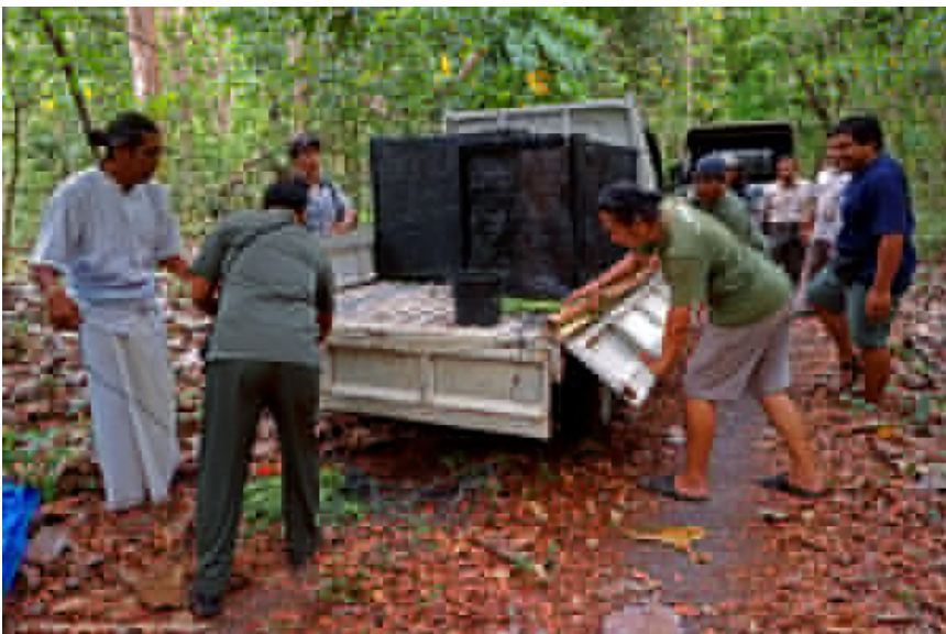
Proses pelepasliaran kelima merak Jawa di Taman Nasional Alas Purwo, Banyuwangi.

Dalam proses pelepasliaran yang dilakukan, tim FNPF sudah tiba di lokasi pelepasan di ujung timur Pulau Jawa, di wilayah Banyuwangi sejak pukul 5 pagi. Sebuah upacara Hindu dilakukan untuk memanjatkan doa kepada Tuhan untuk mendapat restu dan perlindungan sepenuhnya.