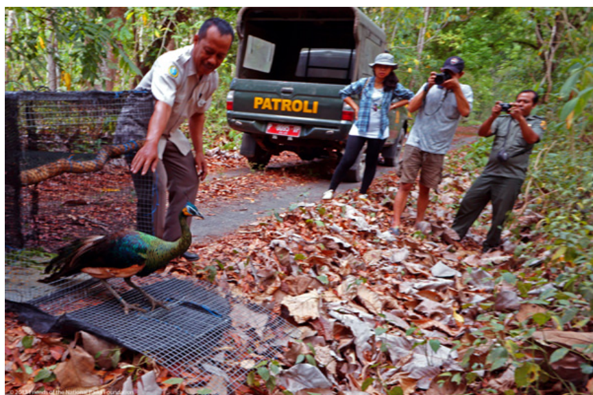
Lima merak Jawa kembali ke habitat asli mereka setelah menjalani rehabilitasi.

Berbagai upaya mengembalikan satwa yang terancam punah dan dilindungi ke habitat mereka terus dilakukan oleh berbagai lembaga rehabilitasi satwa. Sejumlah ancaman, seperti perburuan liar dan perdagangan bagian tubuh atau produk turunan satwa yang terus mengancam, membuat pelepasliaran menjadi sebuah solusi untuk memperpanjang siklus perkembangbiakan sawa-satwa yang masih bisa kembali ke habitat asli mereka.