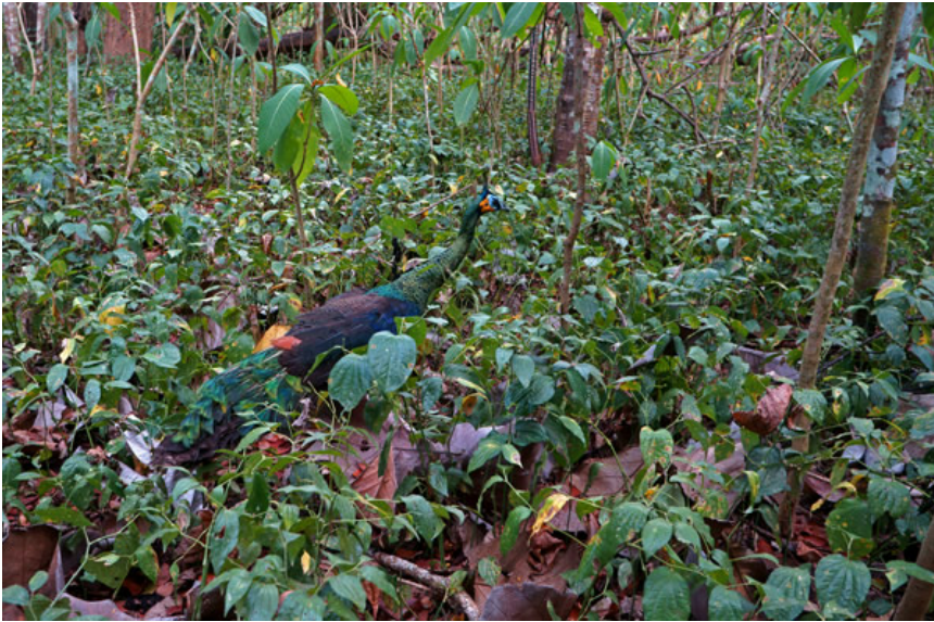
Merak Jawa di habitat aslinya.

Proses rehabilitasi lima individu merak Jawa atau Javan green peafowl ini dilakukan oleh FNPF di pusat penyelamatan satwa mereka di Tabanan, Bali. Fasilitas ini adalah salah satu dari 7 Pusat Penyelamatan Satwa di Indonesia dan memiliki peran penting untuk menjembatani kembalinya sejumlah satwa yang sempat ditangkap dan dipelihara oleh manusia sehingga kehilangan sifat-sifat asli mereka. Sebagian besar satwa yang melalui proses rehabilitasi di lahan seluas 3.200 meter persegi ini adalah satwa korban perdagangan liar dan perburuan.